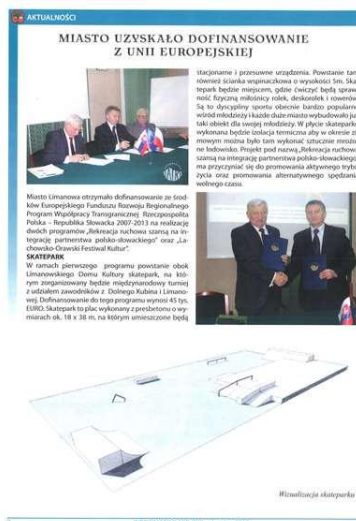
„Informator miejski Limanowa”