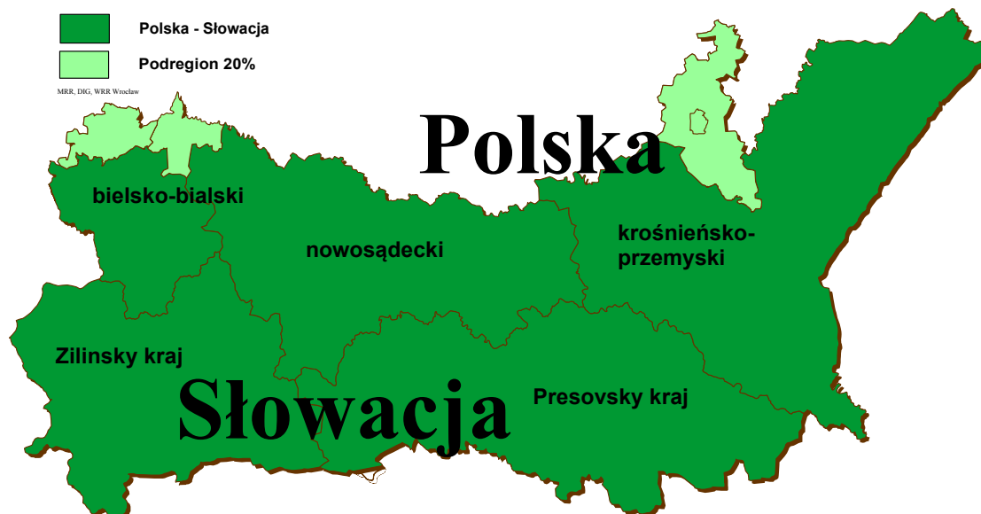
Mapa nr 1 – obszar wsparcia Programu

W powiatach: pszczyńskim, oświęcimskim, rzeszowskim oraz w powiecie grodzkim Rzeszów, projekty będą realizowane zgodnie z art. 21 Rozporządzenia (WE) nr 1080/2006 Parlamentu Europejskiego i Rady z dnia 5 lipca 2006 r. w sprawie Europejskiego Funduszu Rozwoju Regionalnego i uchylającego rozporządzenie (WE) nr 1783/1999 (zwanego dalej Rozporządzeniem (WE) nr 1080/2006) dopuszczającym, w odpowiednio uzasadnionych przypadkach oraz pod warunkiem uzyskania akceptacji PKM Programu, możliwość finansowania wydatków przez partnerów mających siedzibę na obszarach przyległych do zasadniczego obszaru Programu w wysokości do 20% alokowanych na FM środków EFRR. Zasada elastyczności obowiązuje na poziomie całego Programu i będzie monitorowana na poziomie całej alokacji EFRR w ramach wszystkich priorytetów.