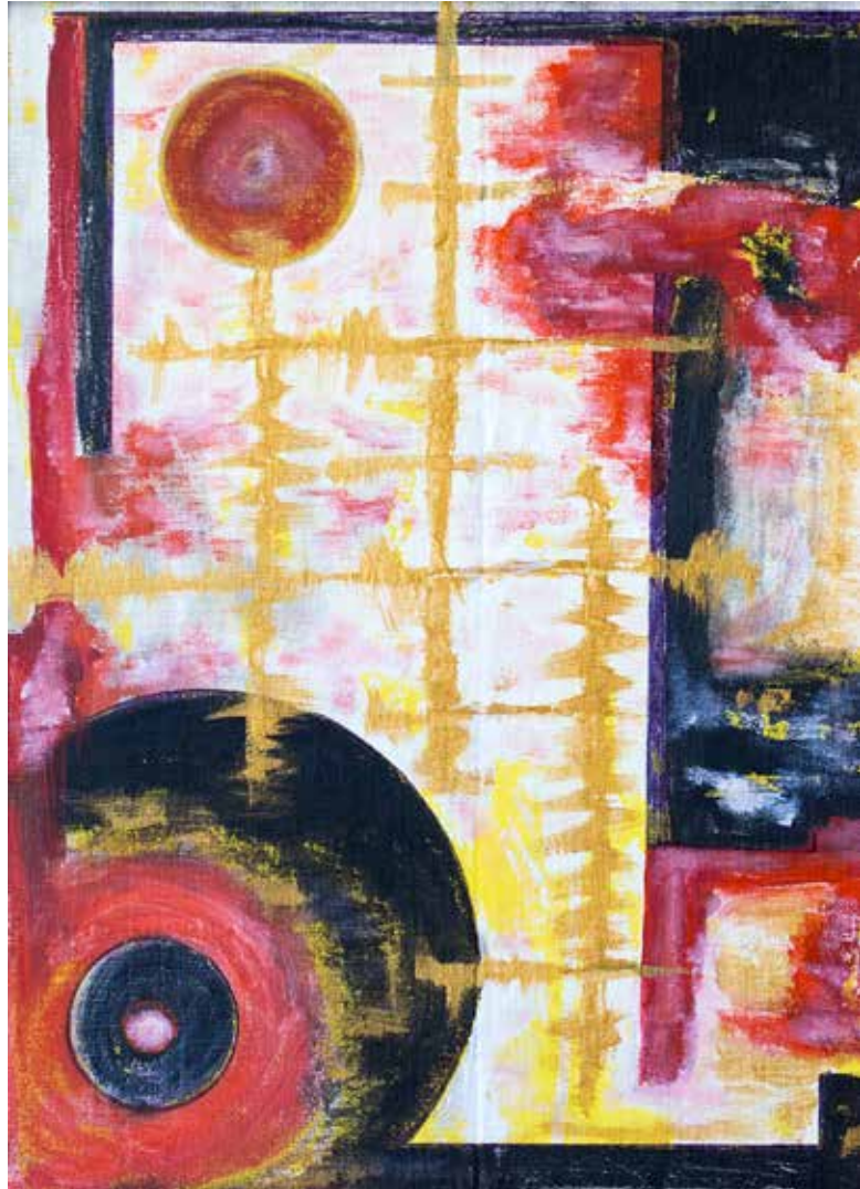
Cztery kręgi, akryl/płótno, 72x52 cm, 2013-2014