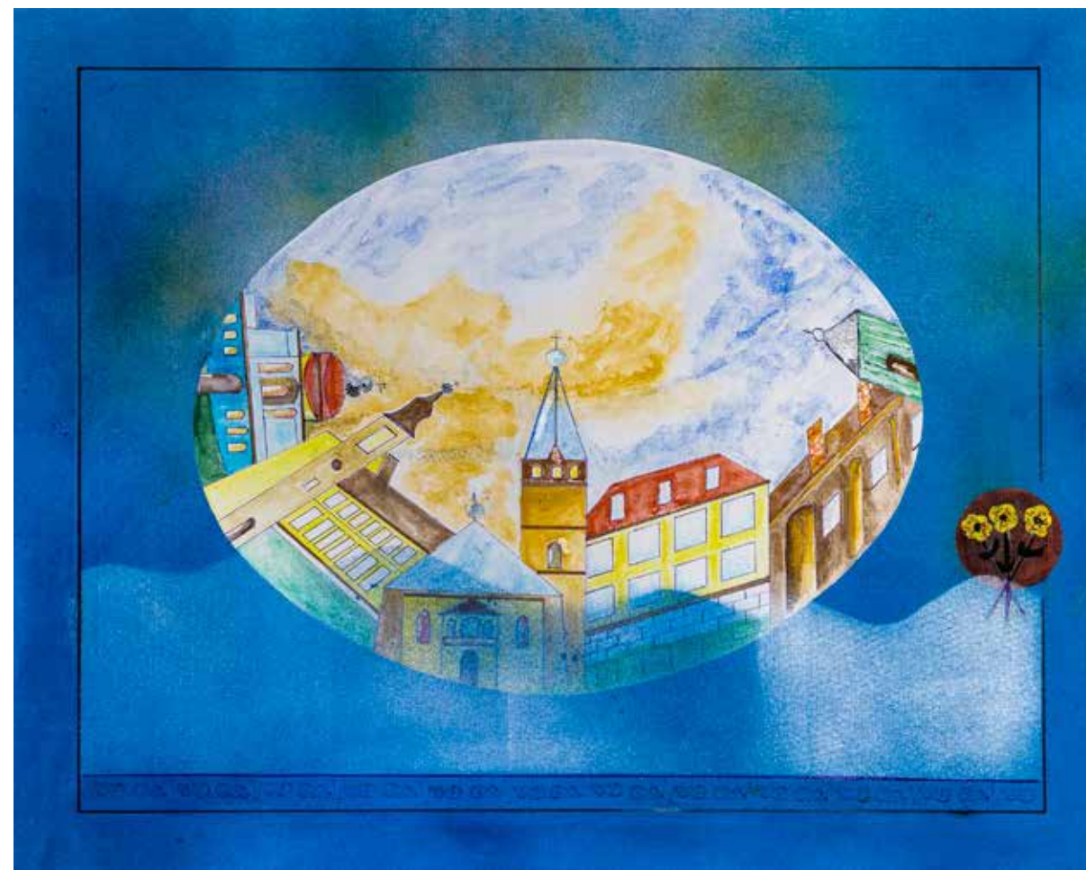
Mój Stropkov, technika mieszana/plótno, 2013, 69 x 56 cm