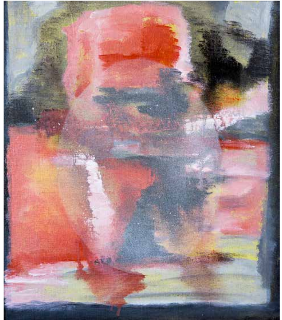
Elipsa I, akryl/płótno, 72x65 cm, 2013-2014