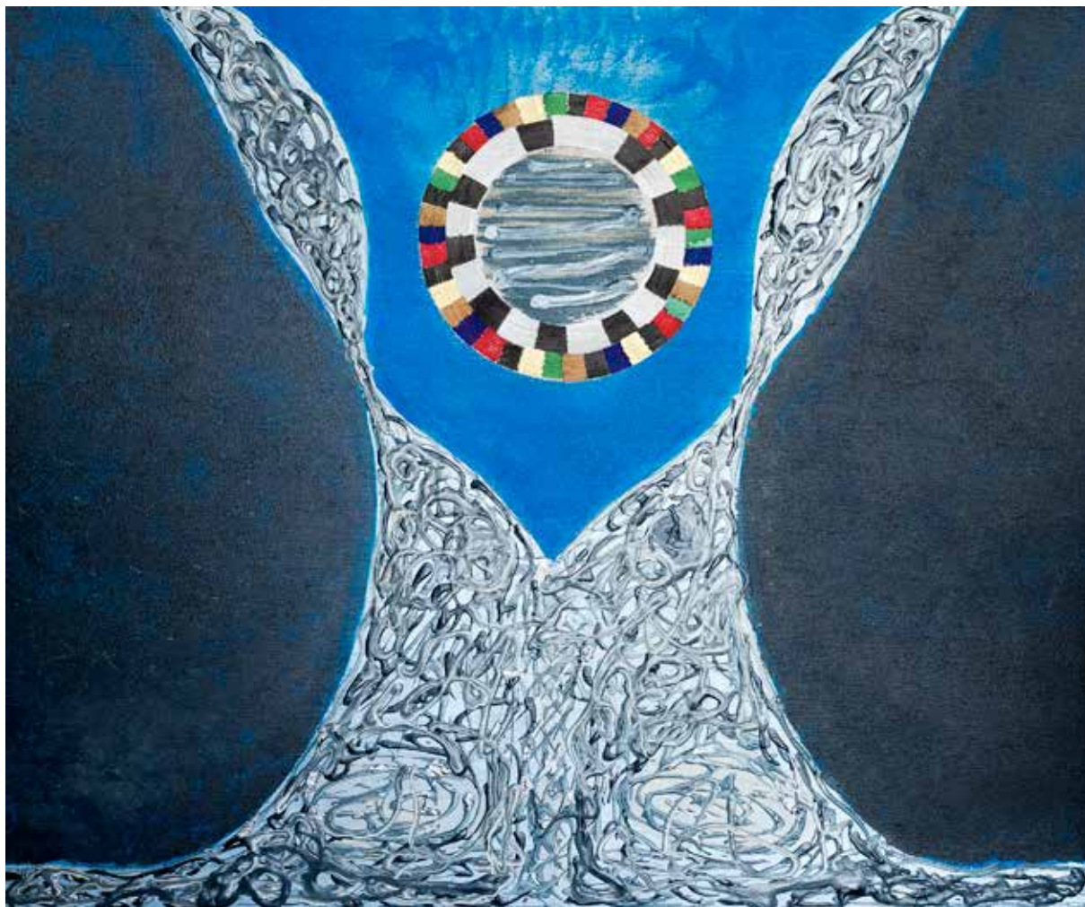
Ciemne słońce, technika mieszana/sklejka, 60x50 cm, 2014-2015