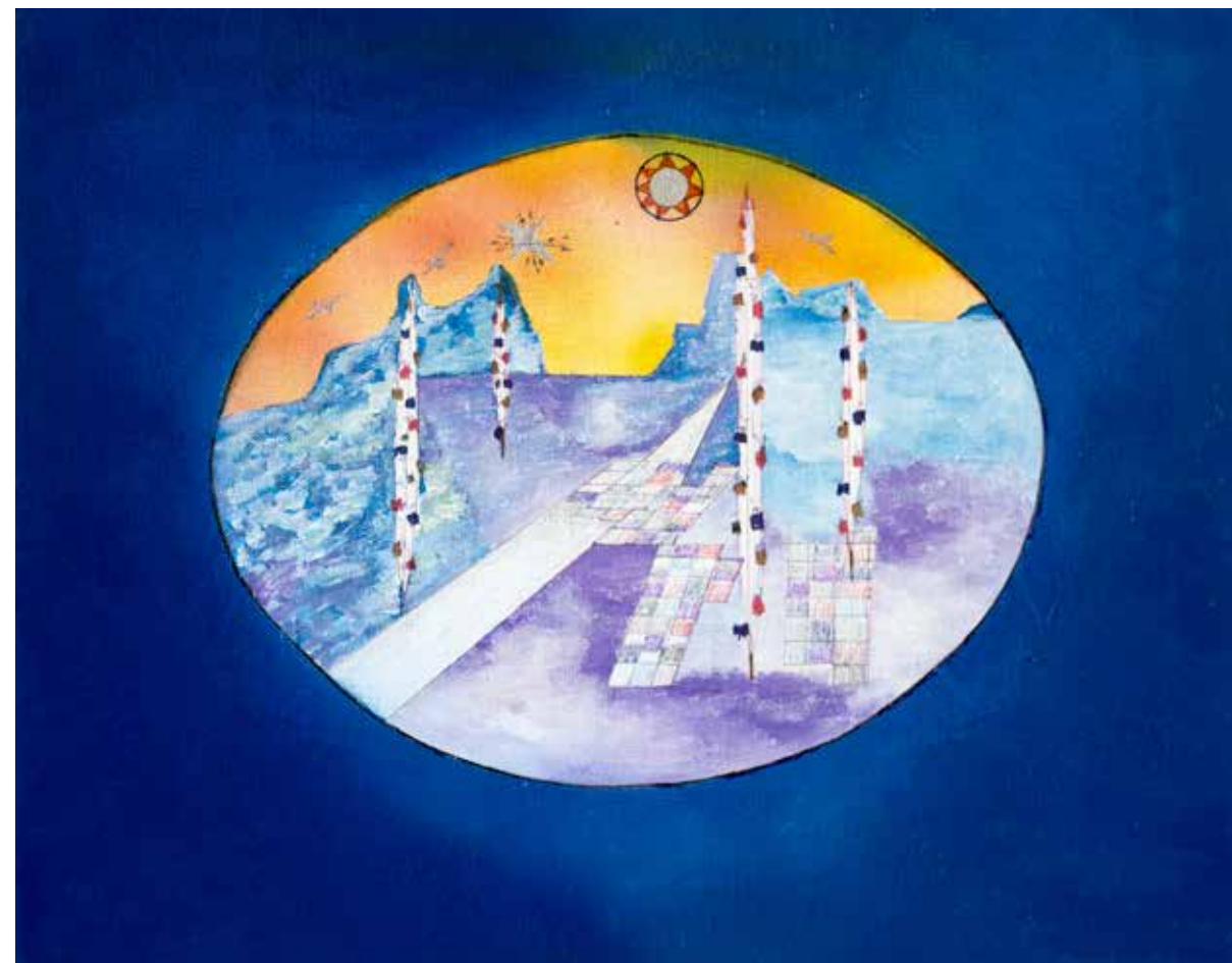
Czekanie na przyłot, technika mieszana/ płótno, 70x56 cm, 2011-2012