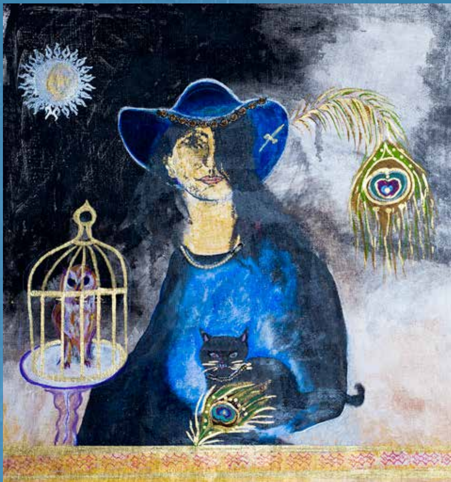
Wystawa z cyklu „Artyści pogranicza polsko-ślowackiego” Ośrodek Współpracy Polsko-Ślowackiej w Nowym Targu sierpień 2015