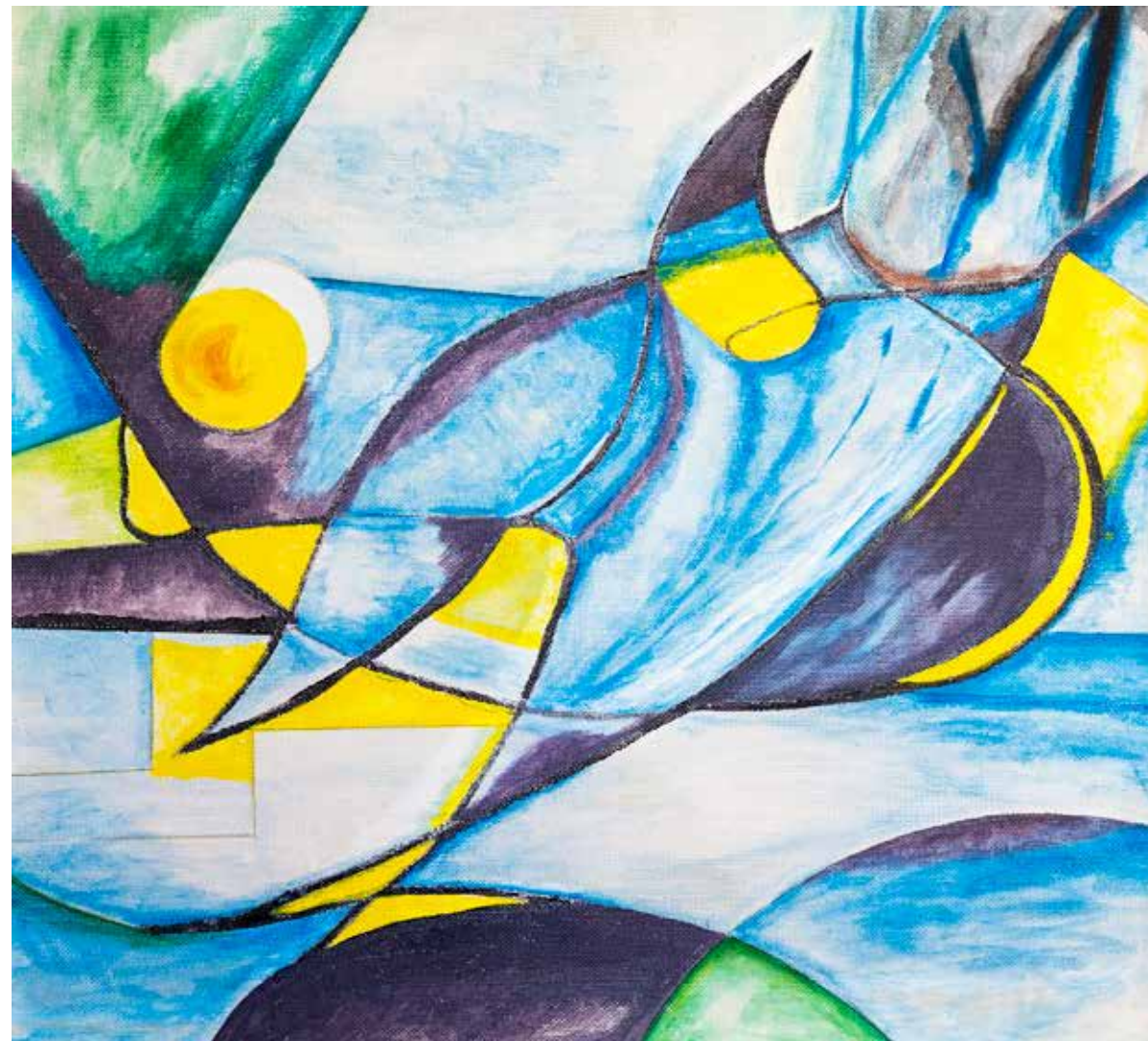
Dzień nietoperza, akryl/ płyta pilśniowa, 66x61 cm, 2012