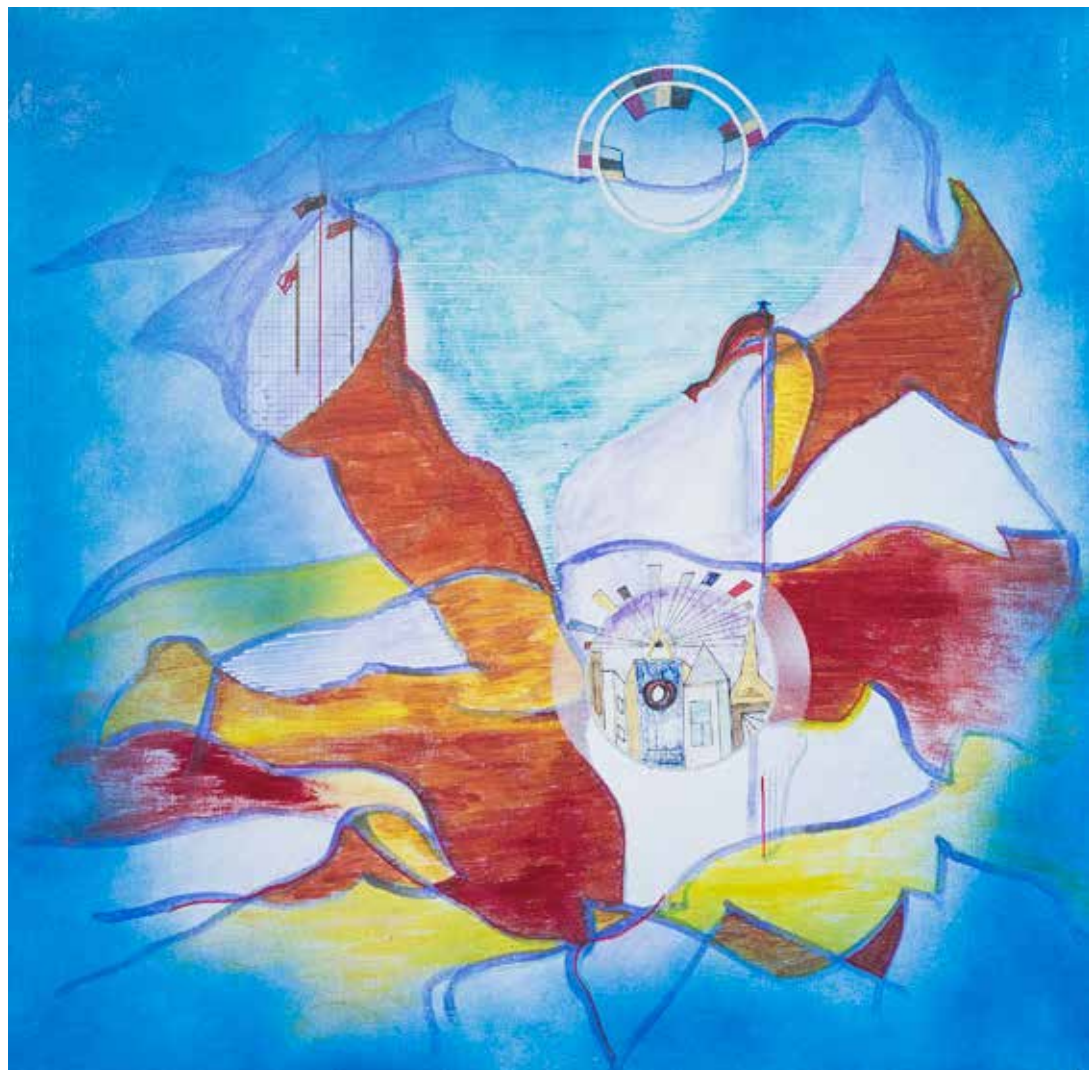
Wspomnienie o urodzajnej krainie, technika mieszana/ płótno, 49x49 cm, 2013