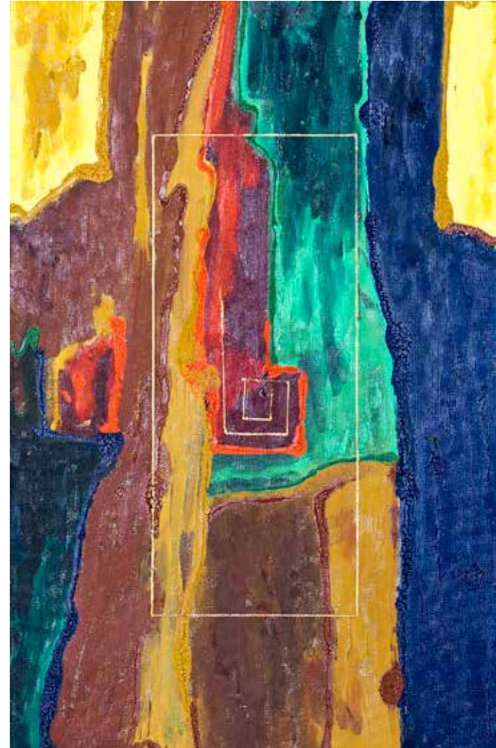
Dokładny przedruk II, olej/płyta pilśniowa, 80x50 cm, 2011