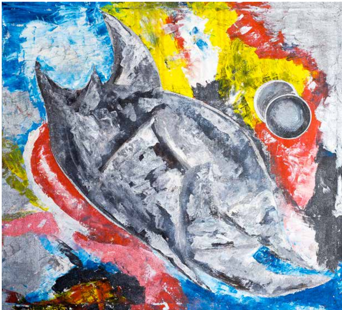
Noc nietoperza, akryl/ płótno, 66x61 cm, 2013-2014