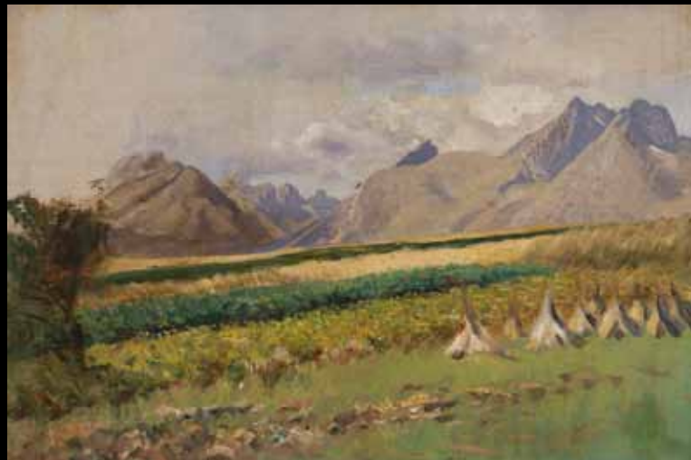
Vysoké Tatry od Strážiek Wysokie Tatry od Strážek