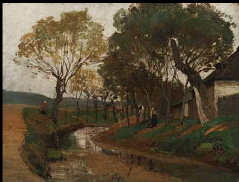
Potok za humnami. Na brehu Potok za stodołami. Przy brzegu