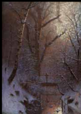
Zimná noc. Postava na moste Zimowa noc. Postać na moście