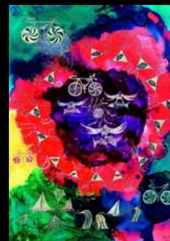
Ściana nietoperzy i ryb