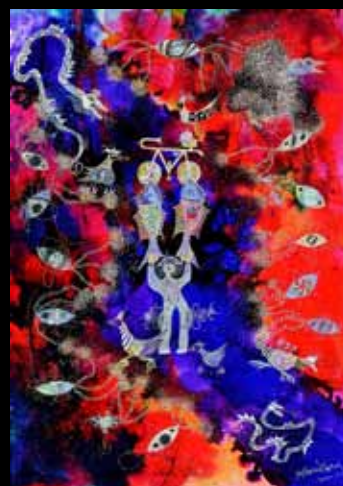
Ściana z pawiem na rowerze