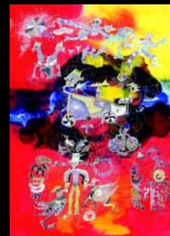
Ściana rewii „tzybercatch”