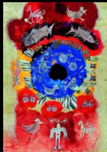
Ściana błękitnego centrum