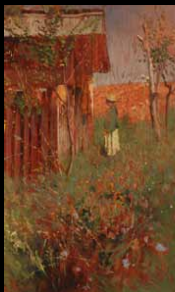
Chlapček při včelíne Chłpiec przy ulu